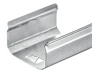
Clip de sujeción 90°