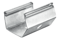
Clip de sujeción 40°